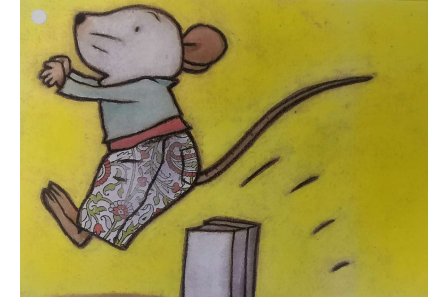
Met 2 voeten gelijk er over springen