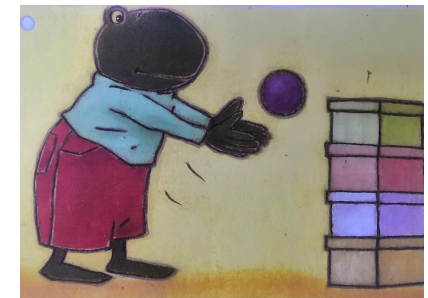
Met een bal omver gooien