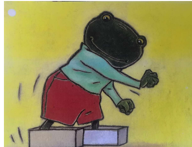
Stappen met schoendozen