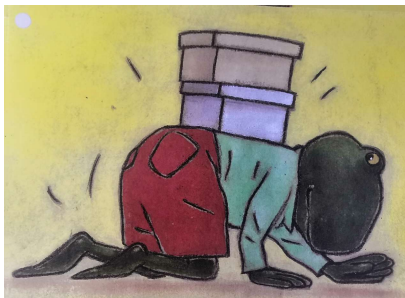
Kruipen met een doos op je rug