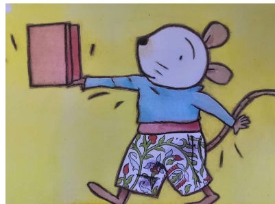
Balanceren op je hand